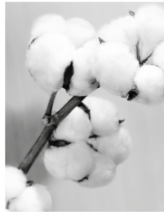
16 782 | T-SHIRT, BOXY-CUT